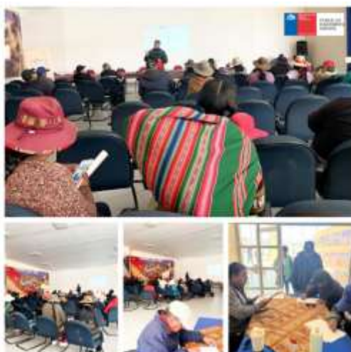
Registros fotográficos reunión 3 etapa Planificación, comuna de General Lagos

Cabe señalar que la actividad contó con apoyo presupuestario del Ministerio del Medio Ambiente con la disposición de un facilitador intercultural y, según el requerimiento previo, un vehículo para traslados ida y vuelta entre Arica, localidades y Visviri, así como el reembolso de gastos por concepto de combustible y servicios de alimentación (café mañana y almuerzo), siendo estos entregados por proveedores locales, como una forma de garantizar que los recursos disponibles se queden en la zona.