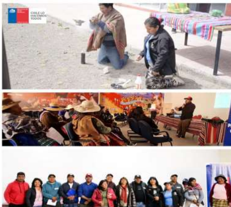
Registro fotográfico reuniones 1 y 2 etapa Planificación, comuna de General Lagos

Cabe señalar que la actividad contó con apoyo presupuestario del Ministerio del Medio Ambiente con la disposición de un facilitador intercultural, vehículos para traslados ida y vuelta entre localidades comuna de General Lagos y Visviri, además del traslado entre Arica y Visviri, reembolso de gastos por concepto de combustible y servicios de alimentación (café mañana y almuerzo), siendo estos entregados por proveedores locales, como una forma de garantizar que los recursos disponibles se quedaran en la zona. Por otro lado, el uso del salón de eventos municipal de General Lagos estuvo gestionado por la SEREMI MMA.