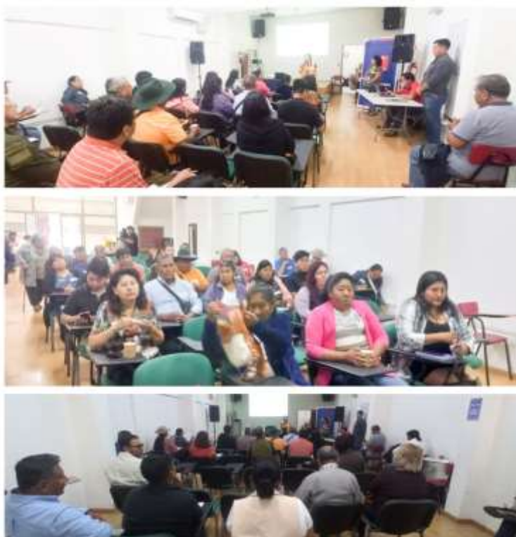
Registros fotográficos Reunión 1 y 2 Etapa Planificación, comuna de Arica

Finalmente, y en esta primera parte, dejar presente que para esta actividad se dispuso de presupuesto, por parte del Ministerio de Medio Ambiente, para contar con la logística necesaria, así como los servicios del facilitador intercultural, el reembolso de pasajes y/o combustible y los servicios de alimentación (café mañana y almuerzo).