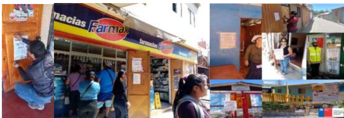
Registros fotográficos trabajo en terreno, difusión del proceso, equipo SEREMI MMA

A lo anterior, se suman otras acciones conducentes al éxito en el desarrollo de las actividades tales como solicitudes de colaboración, coordinación de reuniones u otros relacionados con temas operativos de cada instancia.