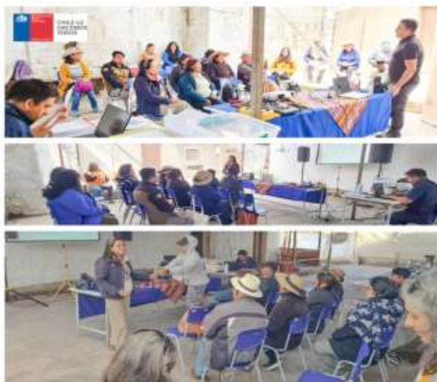
Registros fotográficos reunión 3 etapa Planificación, comuna de Putre