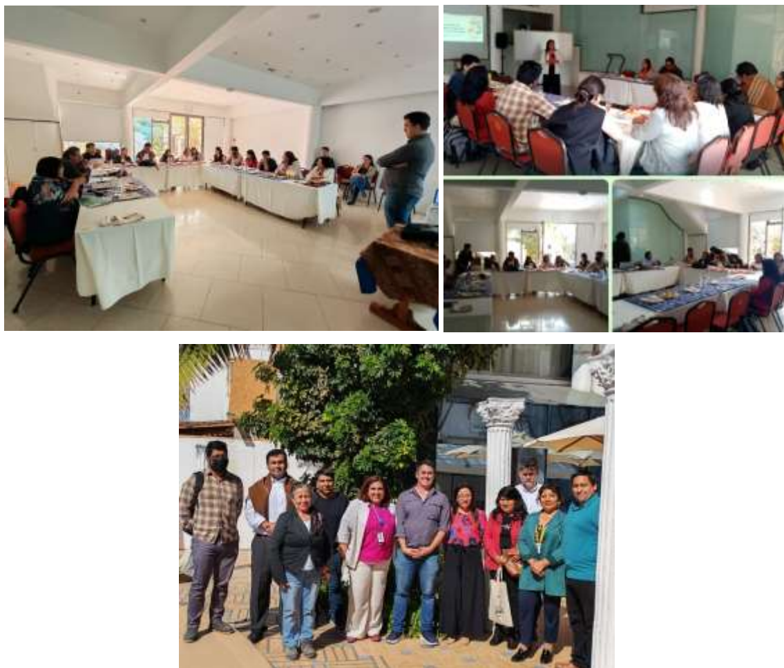
Registros fotográficos Jornada Diálogo Regional, 28/10/2025

Cabe señalar que la jornada contó con recursos presupuestarios proporcionados por el Ministerio del Medio Ambiente, para cubrir lo relacionado con reembolsos por pasajes y/o combustible de cada participante además del servicio de alimentación (café de la mañana y almuerzo).