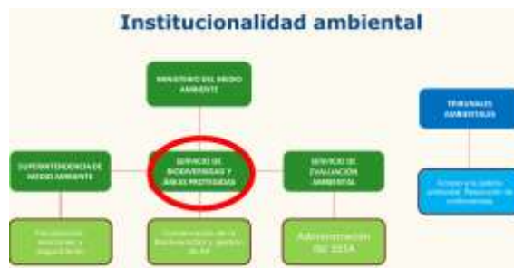
Figura Institucionalidad Ambiental