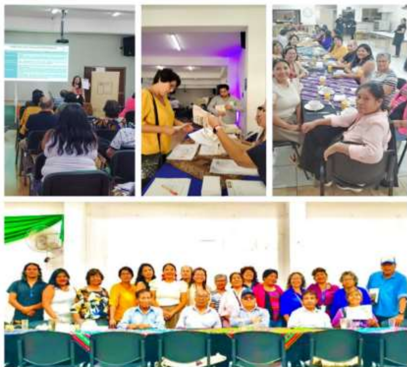
Registros fotográficos reunión 3 etapa de Planificación, comuna de Arica

Finaliza la reunión, proyectando el acta con los acuerdos, su lectura a viva voz, cerrando la actividad con la aprobación del contenido acta, imprimiéndola y entregando in situ a cada participante una copia fiel del acta original.