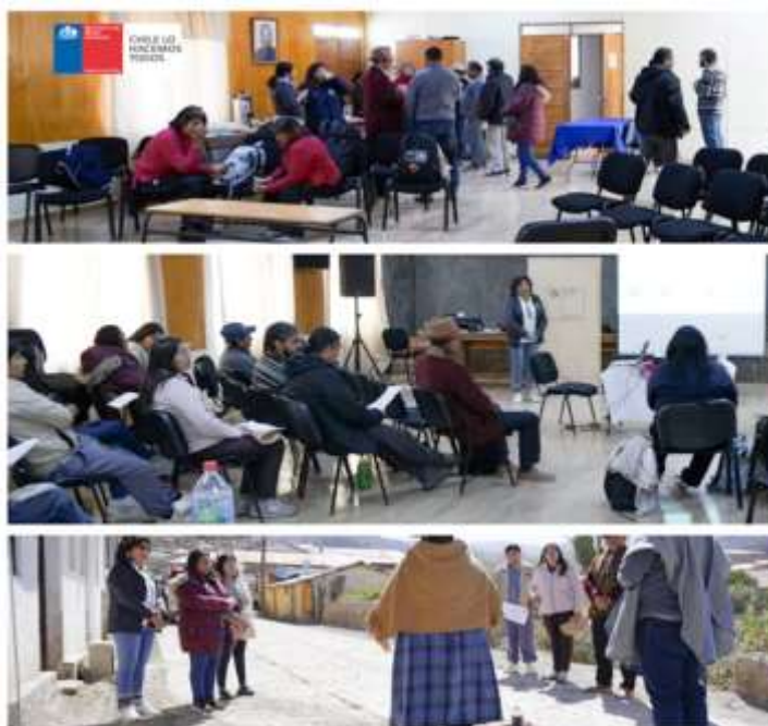
Registros fotográficos reuniones 1 y 2 etapa Planificación, comuna de Putre

Cabe señalar que la actividad del 02 de diciembre contó con apoyo presupuestario del Ministerio del Medio Ambiente con la disposición de un facilitador intercultural, vehículos para traslados ida y vuelta entre localidades comuna de Putre y la localidad de Putre, además del traslado entre Arica y Putre, reembolso de gastos por concepto de combustible y servicios de alimentación (café mañana y almuerzo), siendo estos entregados por proveedores locales, como una forma de garantizar que los recursos disponibles se quedaran en la zona.