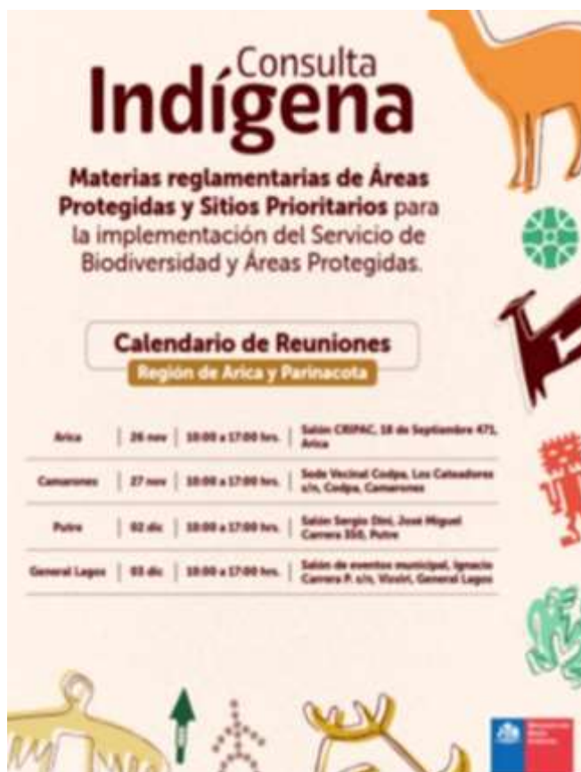
Afiche calendario inicial actividades región, Etapa Planificación Consulta Indígena