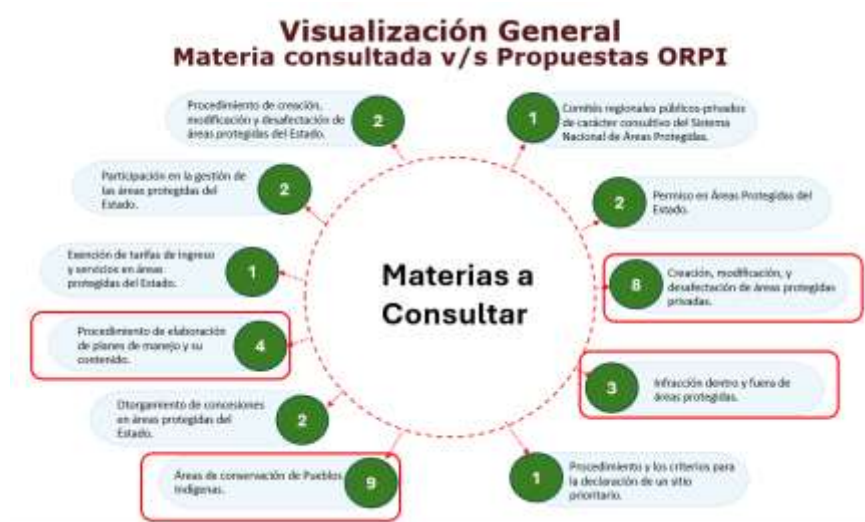
Resumen materias consultadas v/s propuestas comunas

Retoma la palabra el profesional de la unidad técnica y apoyado por una ppt resume la sistematización de los informes recibidos por las comunas y aquellas propuestas que son coincidentes en el interés que se concita para los cuatro territorios.