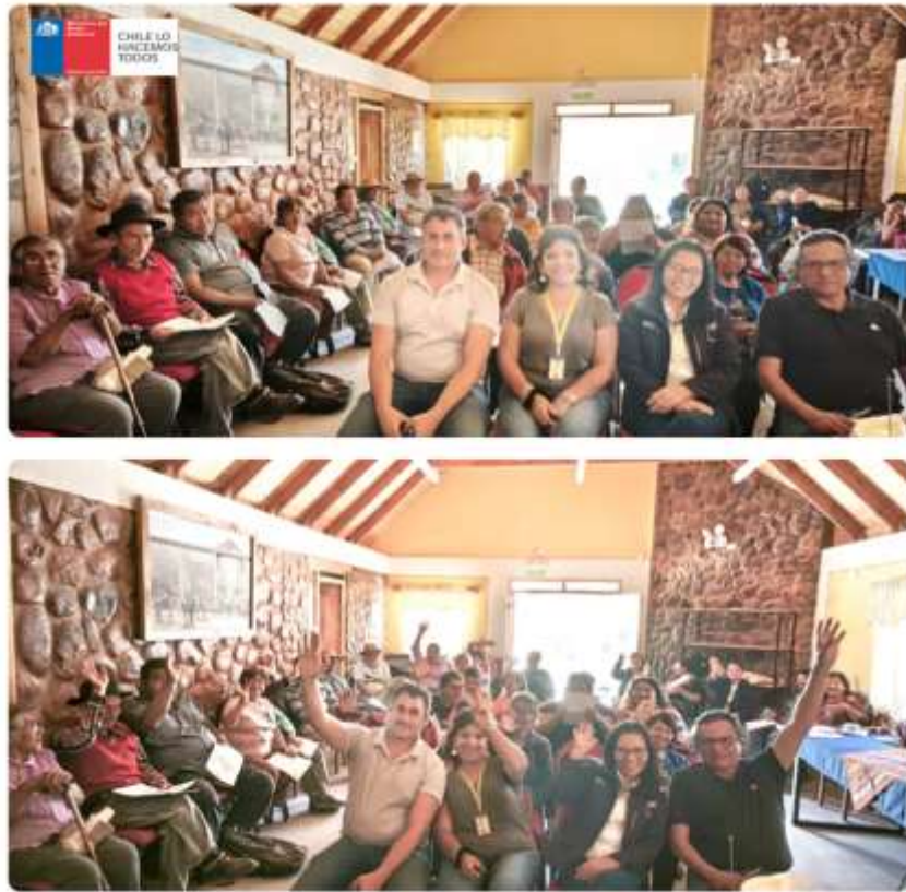
Registros fotográficos reunión 3 Etapa Planificación, comuna de Camarones