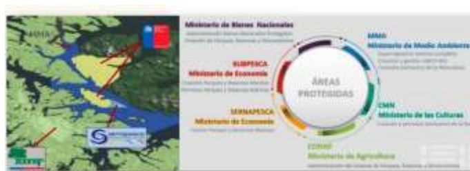
Figura regulación actual en materias áreas protegidas