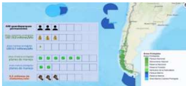
Figura Ley 21.600 y sistema de áreas protegidas

Para una mejor comprensión de los participantes en reunión, se entregaron detalles de los articulados a abordar por la consulta indígena, distribuyendo la exposición de materias en el sgte. Orden: