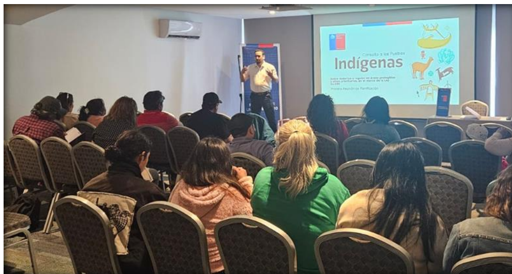
Reunión correspondiente a la etapa de planificación realizada en la ciudad de Antofagasta.

Durante el año 2024, se desarrollaron las etapas de planificación y entrega de información; y durante el año 2025, con las etapas de deliberación interna (por parte de los pueblos indígenas), etapa de diálogo, y etapa de sistematización.