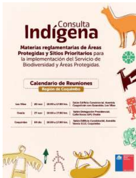
IMAGEN 9 GRÁFICA CALENDARIO REUNIONES DE PLANIFICACIÓN.

Finalmente, con el objeto de reforzar la publicidad y facilitar la participación de los intervinientes, el Ministerio del Medio Ambiente elaboró y difundió gráficas informativas relativas al calendario de las reuniones de planificación y de entrega de información, las cuales se presentan en las imágenes N°9 y N°10, respectivamente.