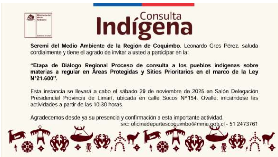
IMAGEN 16 INVITACIÓN ENVIADA A LOS REPRESENTANTES Y SUPLENTES, PARA LA REUNIÓN DE DIÁLOGO REGIONAL.

incluyo a los representantes y suplentes definidos por las comunidades y asociaciones durante la etapa de deliberación interna, junto con sus asesores técnicos.