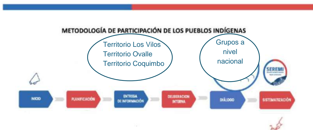
IMAGEN 3 METODOLOGÍA DE PARTICIPACIÓN DE LOS PUEBLOS INDÍGENAS

A partir de la caracterizacion territorial y del número de organizaciones participantes antes descritas, se definió la metodolofía de desarrollo del proceso, la cual se estructuró en etapas, conforme lo establece la normativa vigente.