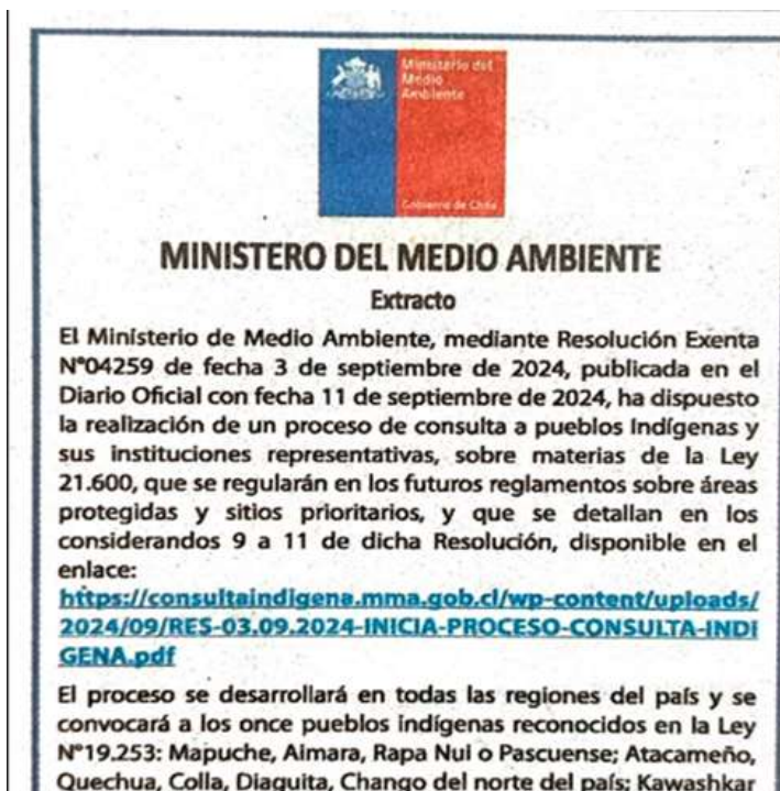
IMAGEN 5 EXTRACTO DE PUBLICACIÓN DE LA CONVOCATORIA EN DIARIO DE CIRCULACIÓN NACIONAL.

Adicionalmente, y en cumplimiento de los mecanismos de publicidad complementarias establecidos anteriormente, la convocatoria fue publicada mediante extractos en un diario de circulación nacional, específicamente en el diario Las Últimas Noticias, la cual es posible revisar en el siguiente enlace: Página 6 LUN 25.09.24 https://www.lun.com/default.aspx?dt=2024-09-25