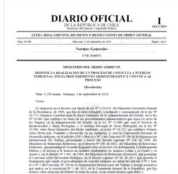
Imagen 1: Publicación Diario Oficial, 11 septiembre 2024.

En la siguiente imagen se da cuenta de la publicación en Diario Oficial.