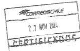
Imagen 5: Guía de admisión para envío de carta certificada a las comunidades y asociaciones indígenas de la región, 28 de noviembre de 2024.