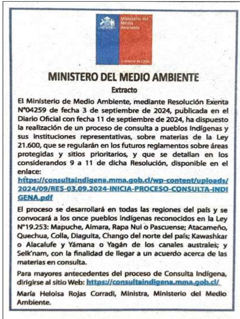
Imagen 2: Publicación Diario Las últimas noticias, 25 de septiembre de 2024.

Se realizó la publicación de la convocatoria para el inicio del Proceso de Consulta Indígena en “Diario Las últimas noticias”, un diario de circulación nacional, con fecha 25 de septiembre de 2024 conforme se da cuenta en las siguientes imágenes.