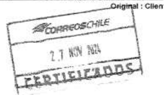
Imagen 6: Guía de admisión para envío de carta certificada a las comunidades y asociaciones indígenas de la región, 28 de noviembre de 2024.