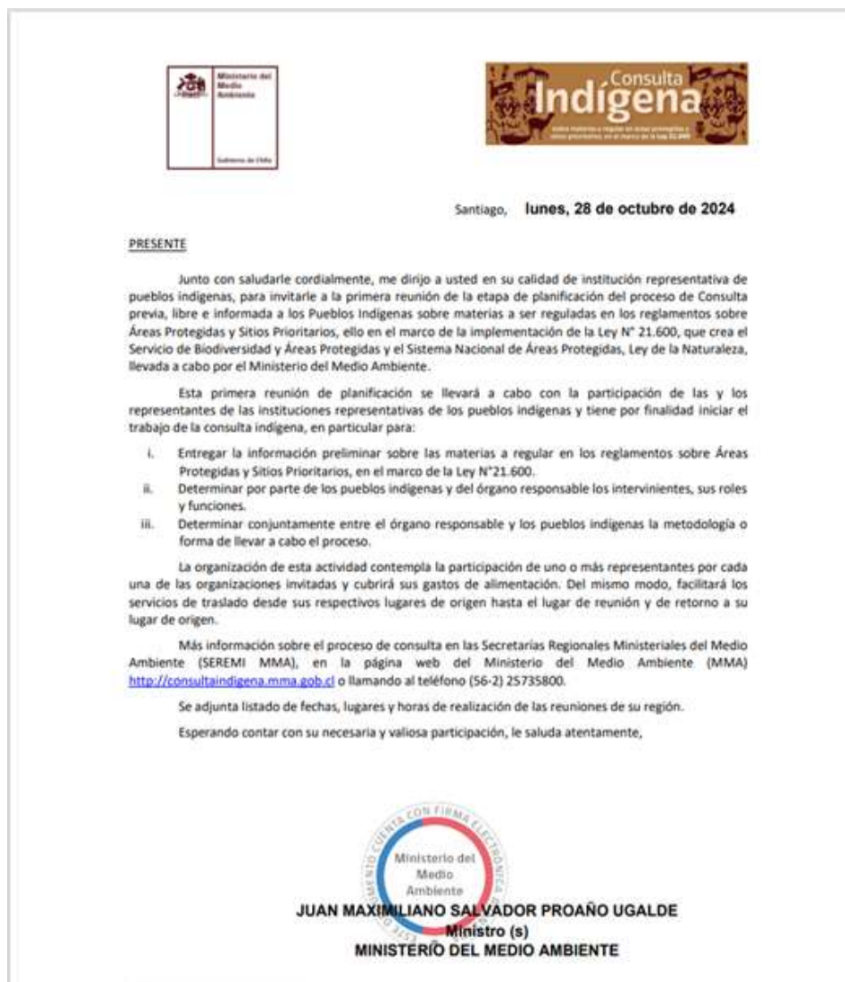
Imagen 3: Carta enviada a las Comunidades y Asociaciones Indígenas de la región, 28 de octubre de 2024

A partir de dicha información se procedió al envío de la carta mediante correo certificado a los domicilios indicados en el Registro, según el siguiente detalle.